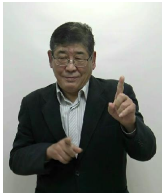
「ろう運動のあれこれ」