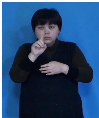
「海外旅行の思い出」