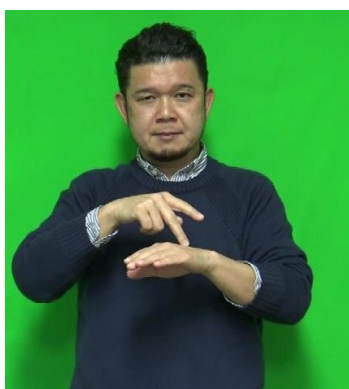
「アジアからの研修生」