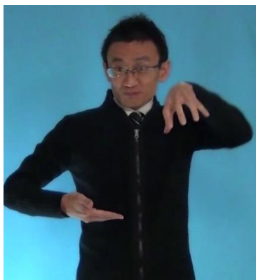
「安い給料で働く友達」