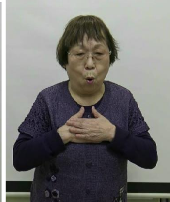
「人生の苦勞と楽しみ」